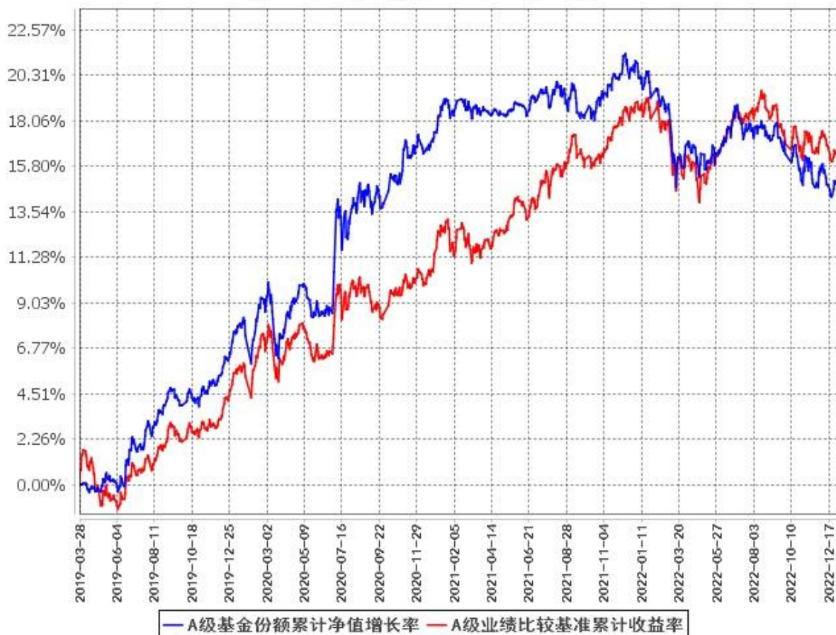
A级基金份额累计净值增长率与同期业绩比较基准收益率的历史走势对比图 (2019年3月28日至2022年12月31日)