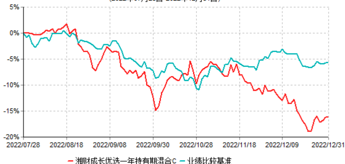
湘财成长优选一年持有期混合C累计净值增长率与业绩比较基准收益率历史走势对比图 (2022年07月28日-2022年12月31日)