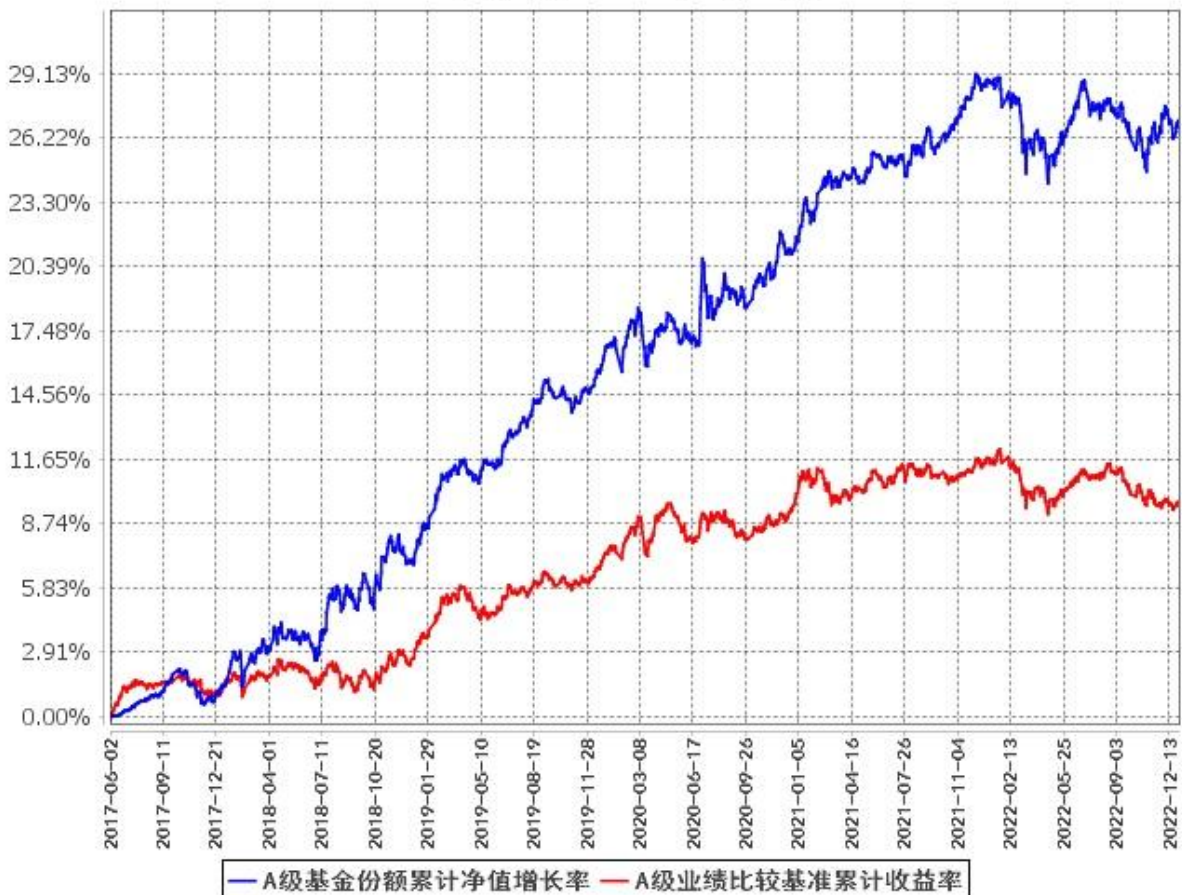
A级基金份额累计净值增长率与同期业绩比较基准收益率的历史走势对比图 (2017年6月2日至2022年12月31日)