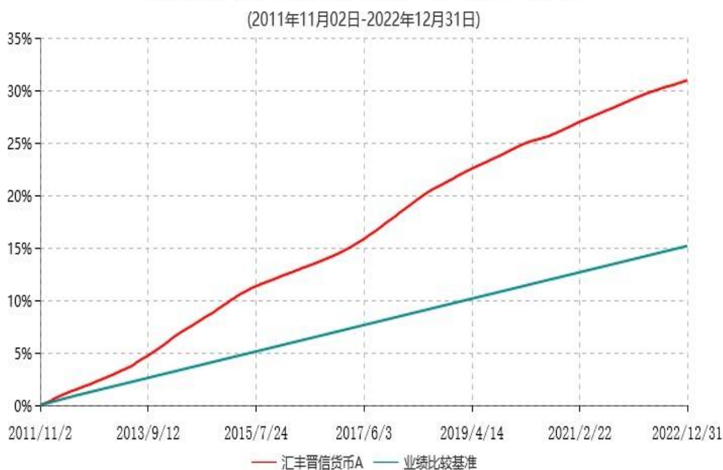
汇丰晋信货币A累计净值收益率与业绩比较基准收益率历史走势对比图