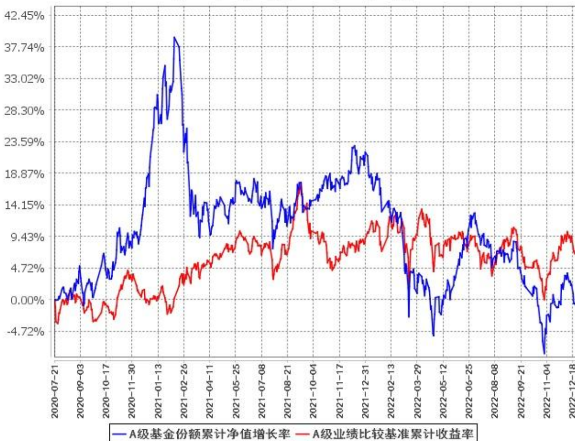
A级基金份额累计净值增长率与同期业绩比较基准收益率的历史走势对比图 (2020年7月21日至2022年12月31日)