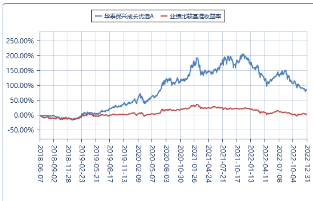
华泰保兴成长优选 A