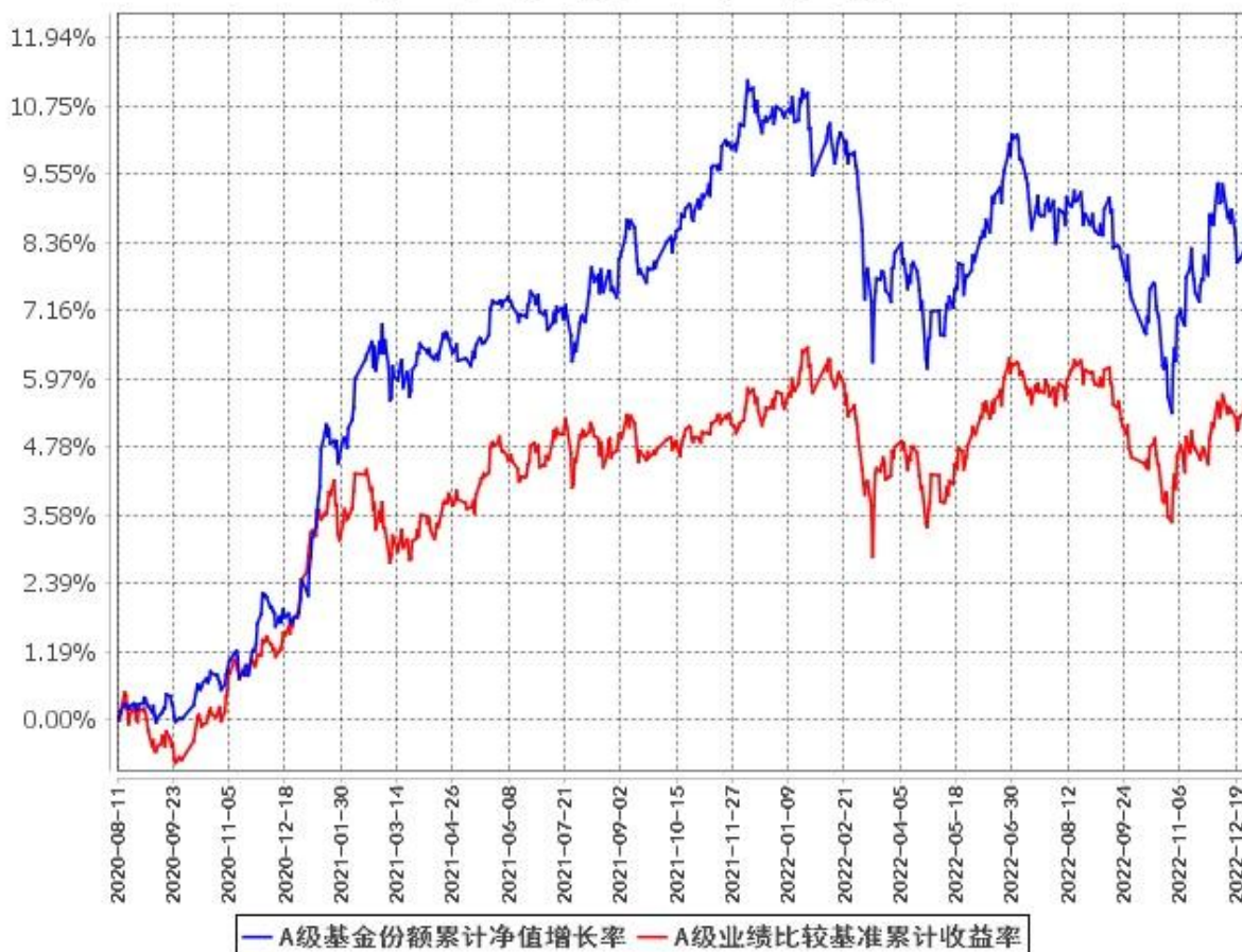
A级基金份额累计净值增长率与同期业绩比较基准收益率的历史走势对比图 (2020年8月11日至2022年12月31日)