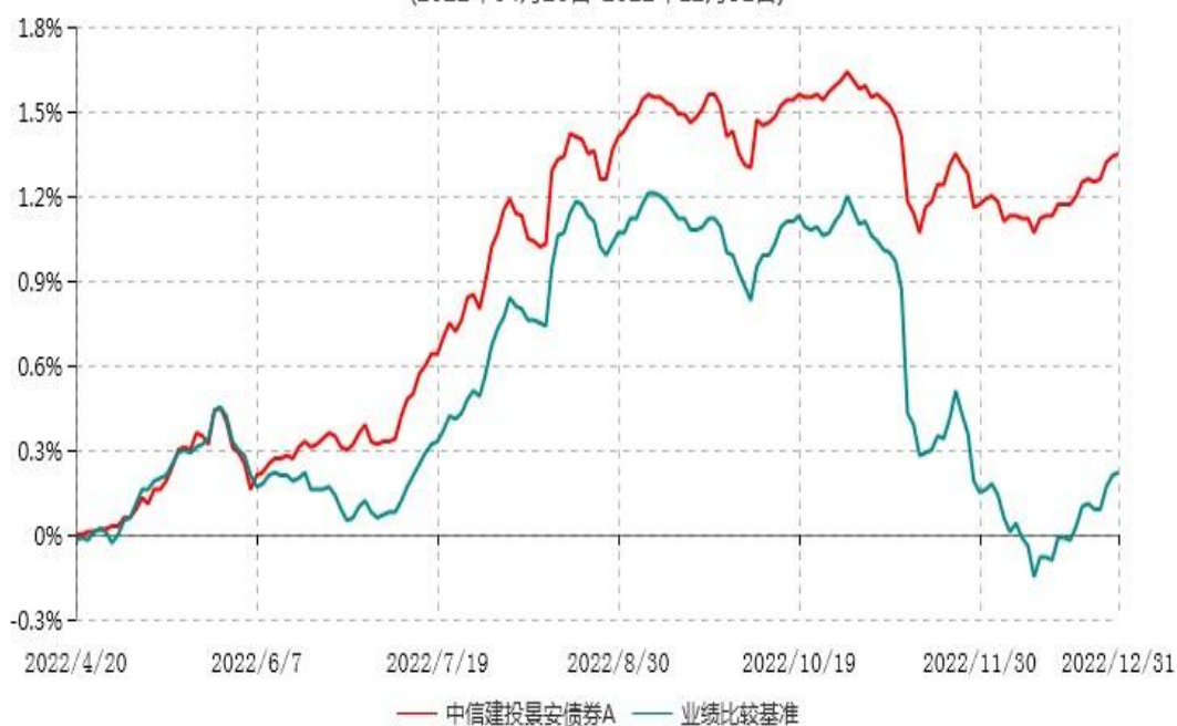
中信建投景安债券A累计净值增长率与业绩比较基准收益率历史走势对比图 (2022年04月20日-2022年12月31日)