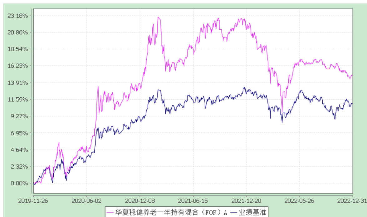
华夏稳健养老一年持有混合 (FOF) Y: