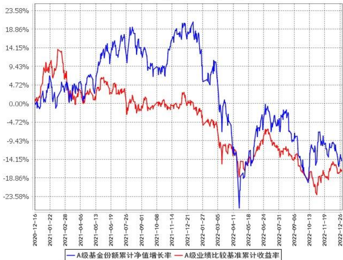
A级基金份额累计净值增长率与同期业绩比较基准收益率的历史走势对比图 (2020年12月16日至2022年12月31日)