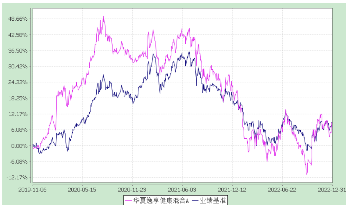
华夏逸享健康混合 C: