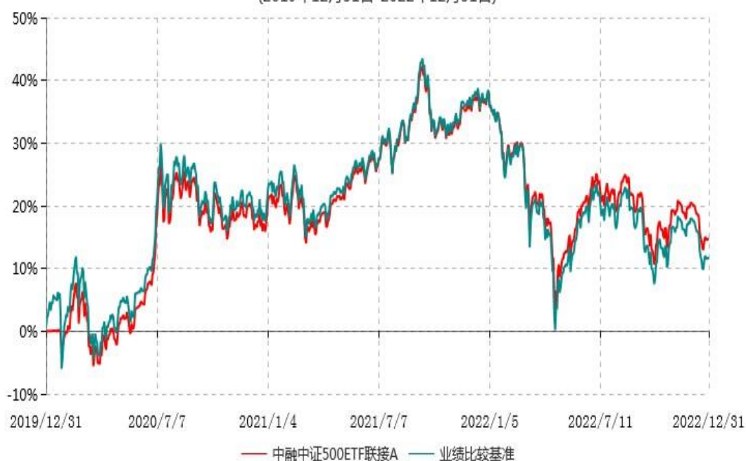
中融中证500ETF联接A累计净值增长率与业绩比较基准收益率历史走势对比图 (2019年12月31日-2022年12月31日)