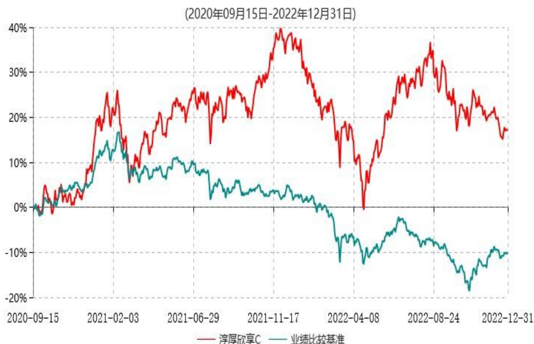
淳厚欣享C累计净值增长率与业绩比较基准收益率历史走势对比图

注：本基金基金合同生效日为 2020 年 9 月 15 日。按基金合同规定，本基金自基金合同生效起 6 个月内为建仓期。建仓期结束时本基金的各项投资比例均符合基金合同约定。