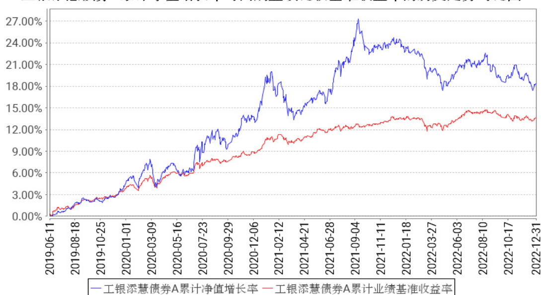
工银添慧债券A累计净值增长率与同期业绩比较基准收益率的历史走势对比图