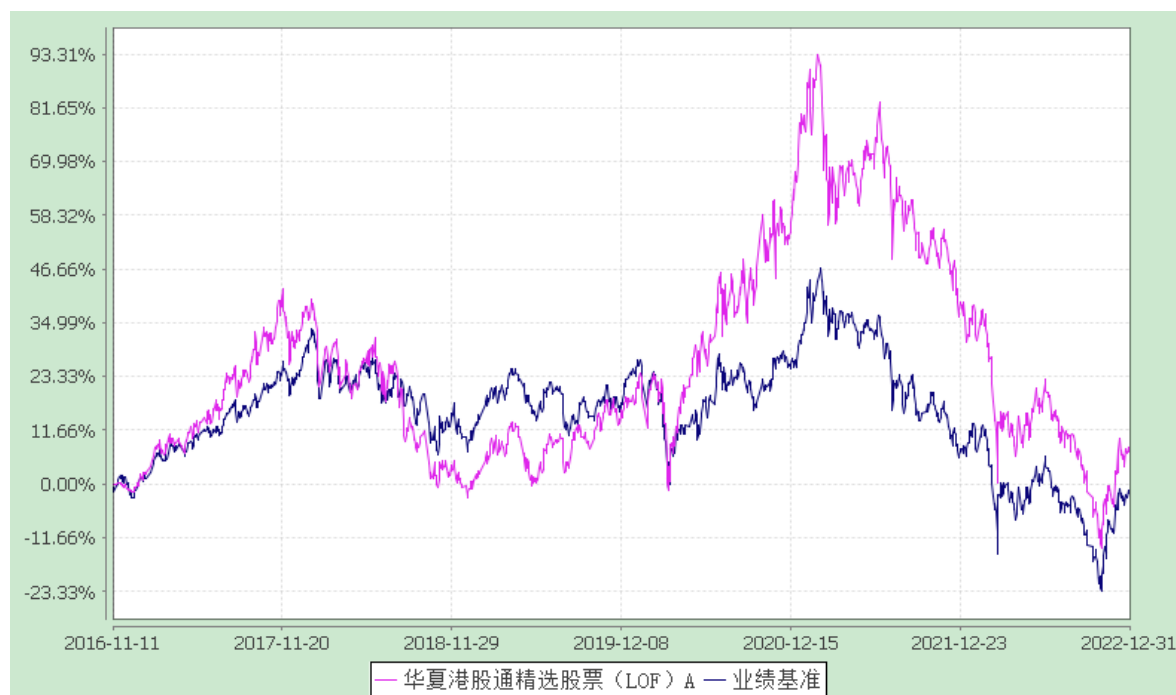
华夏港股通精选股票 C: