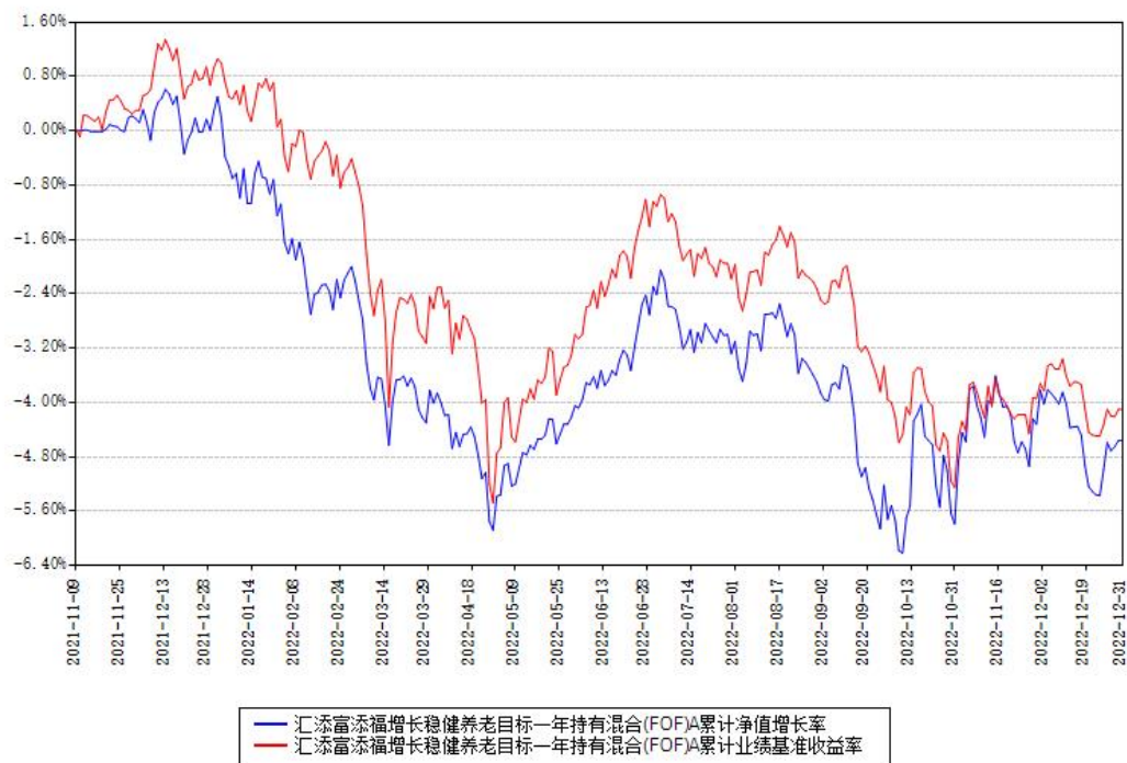
汇添富添福增长稳健养老目标一年持有混合(FOF)Y累计净值增长率与同期业绩基准收益率对比图