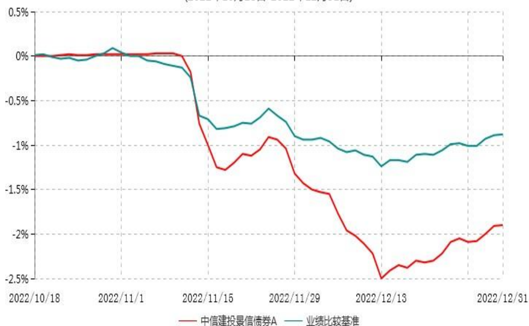
中信建投景信债券A累计净值增长率与业绩比较基准收益率历史走势对比图 (2022年10月18日-2022年12月31日)