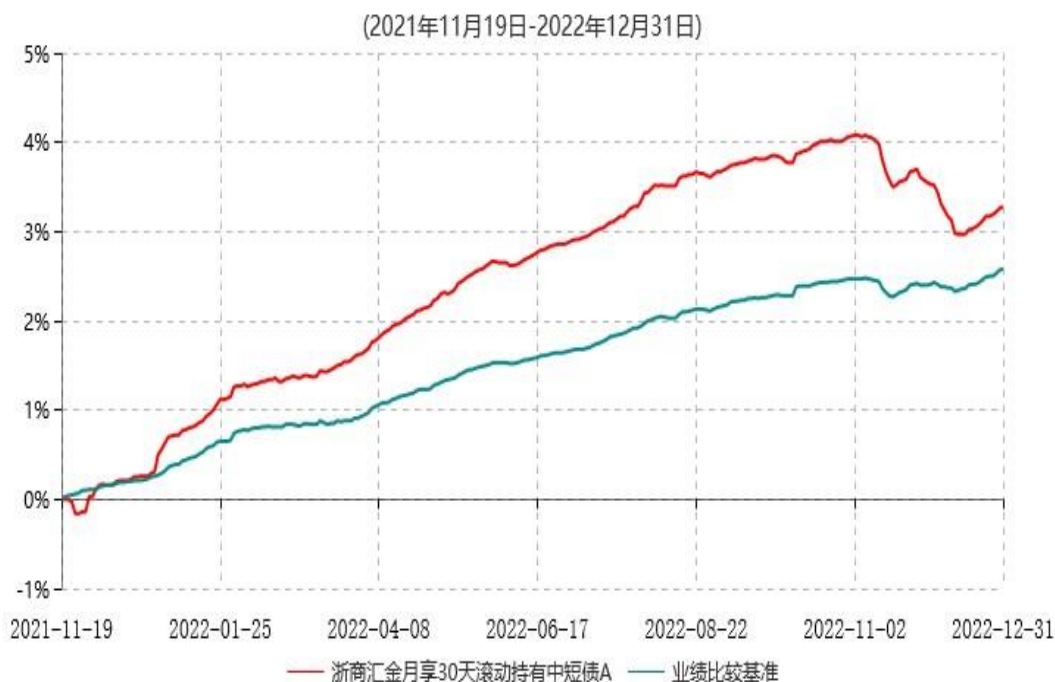
浙商汇金月享30天滚动持有中短债A累计净值增长率与业绩比较基准收益率历史走势对比图

注：本基金合同生效日为2021年11月19日。至本报告期末，本基金已完成建仓。建仓期为2021年11月19日-2022年5月18日，但报告期末距建仓结束不满一年，建仓期结束时各项资产配置比例符合合同约定。