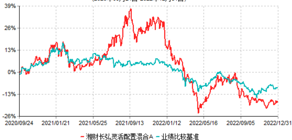
湘财长弘灵活配置混合A累计净值增长率与业绩比较基准收益率历史走势对比图 (2020年09月24日-2022年12月31日)