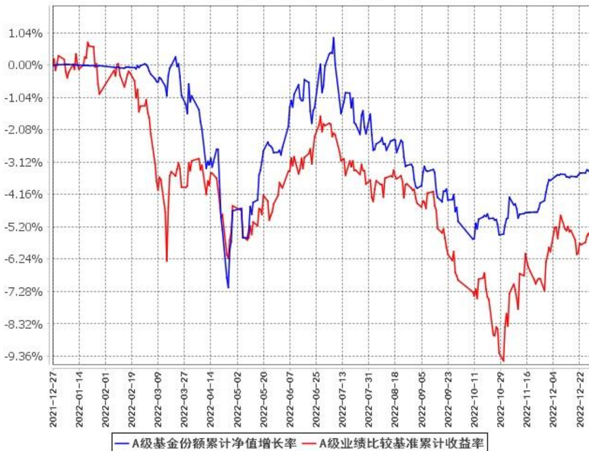
A级基金份额累计净值增长率与同期业绩比较基准收益率的历史走势对比图 (2021年12月27日至2022年12月31日)