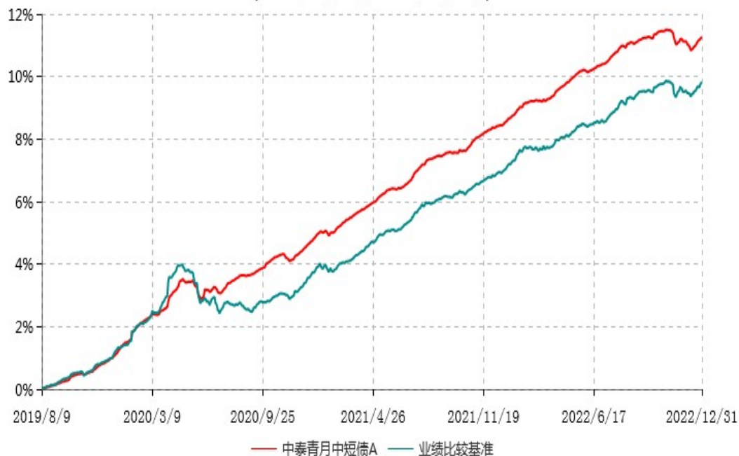
中泰青月中短债A累计净值增长率与业绩比较基准收益率历史走势对比图 (2019年08月09日-2022年12月31日)