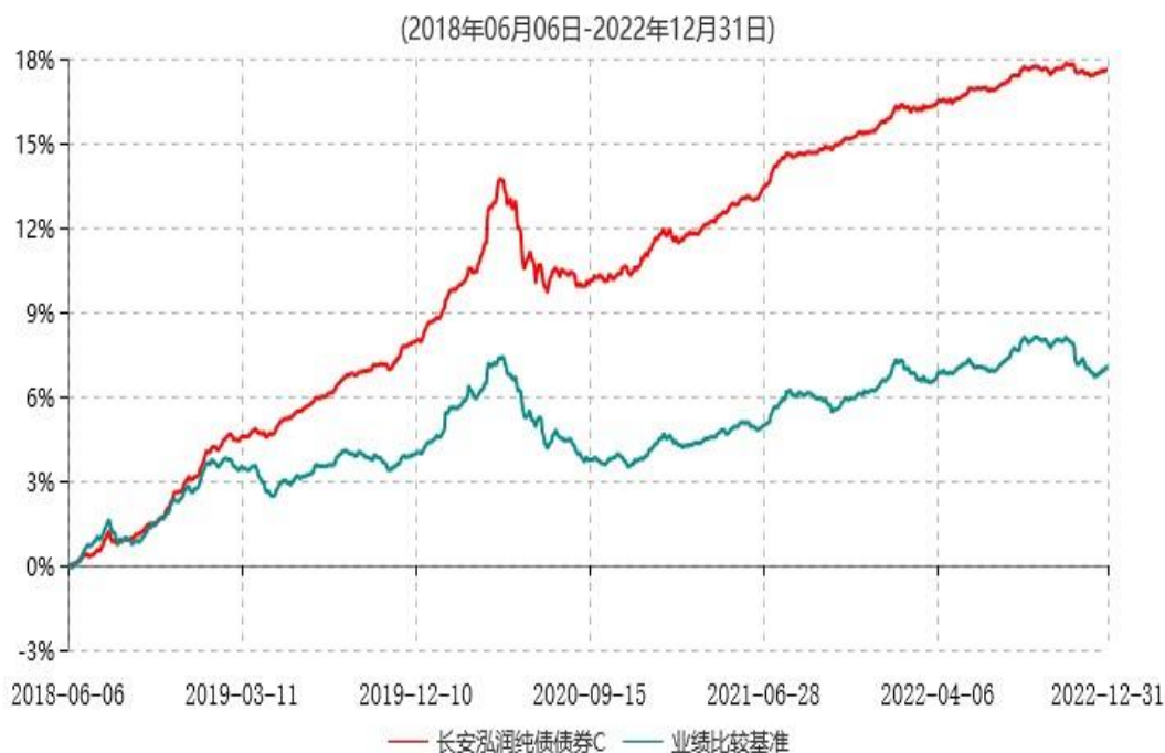
长安泓润纯债债券C累计净值增长率与业绩比较基准收益率历史走势对比图

根据基金合同的规定，自基金合同生效日起 6 个月内基金各项资产配置比例需符合基金合同要求。本基金在建仓期结束后，各项资产配置比例已符合基金合同有关投资比例的约定。基金合同生效日至报告期末，本基金运作时间已满一年。图示日期为 2018 年 6 月 6 日至 2022 年 12 月 31 日。