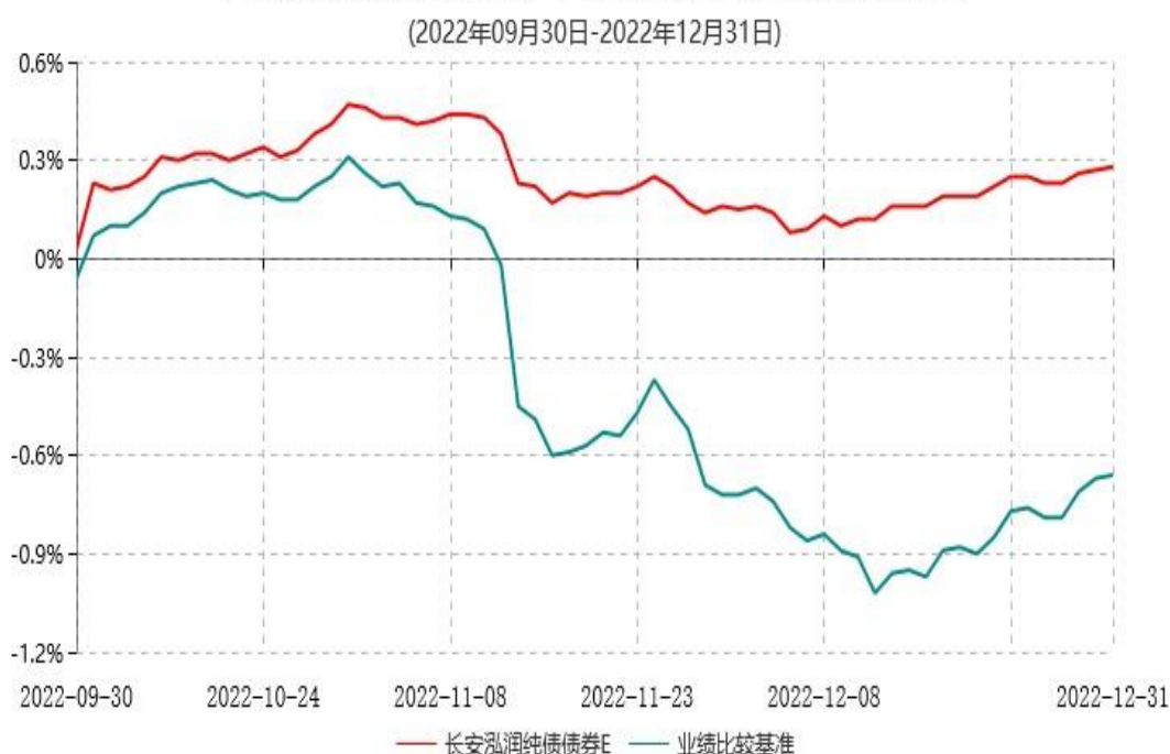
长安泓润纯债债券E累计净值增长率与业绩比较基准收益率历史走势对比图

长安泓润纯债债券型证券投资基金于 2022 年 9 月 29 日公告新增 E 类份额，实际首笔 E 类份额申购申请于 2022 年 9 月 30 日确认，图示日期为 2022 年 9 月 30 日至 2022 年 12 月 31 日。