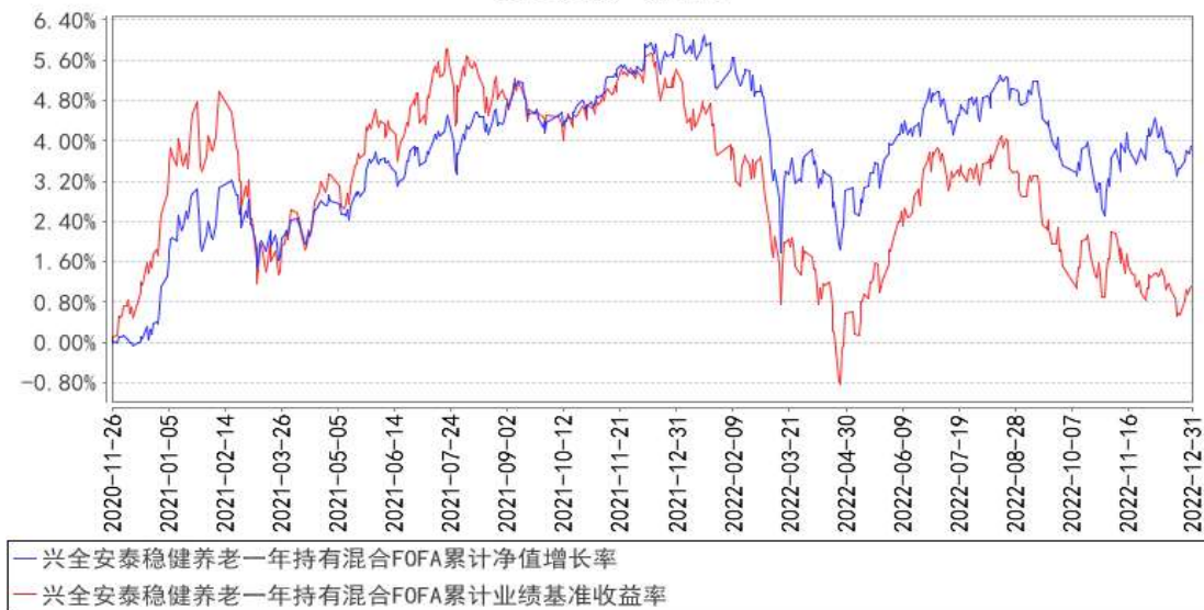
兴全安泰稳健养老一年持有混合FOFA累计净值增长率与同期业绩比较基准收益率的历史走势对比图