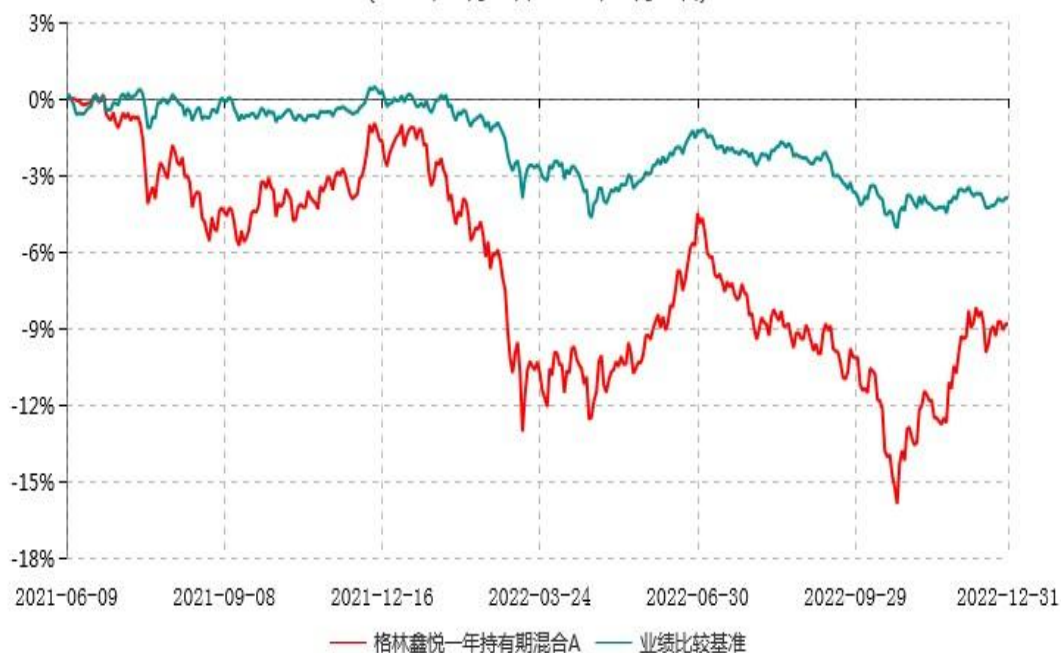
格林鑫悦一年持有期混合A累计净值增长率与业绩比较基准收益率历史走势对比图 (2021年06月09日-2022年12月31日)