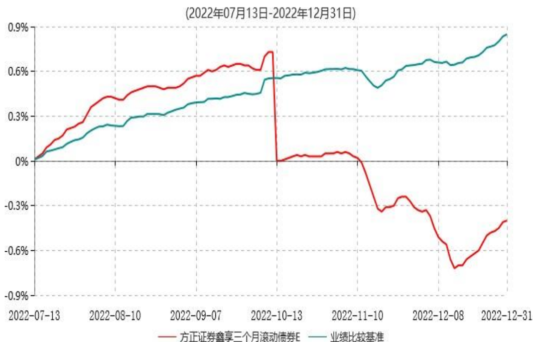
方正证券鑫享三个月滚动债券E累计净值增长率与业绩比较基准收益率历史走势对比图

注：1、基金合同生效日为 2022 年 5 月 25 日，方正证券鑫享三个月滚动债券 E 自 2022 年 7 月 1 日起开放申购和赎回业务，首个投资者于 2022 年 7 月 12 日提交申购申请。截至 2022 年 12 月 31 日，本基金合同生效不满一年。