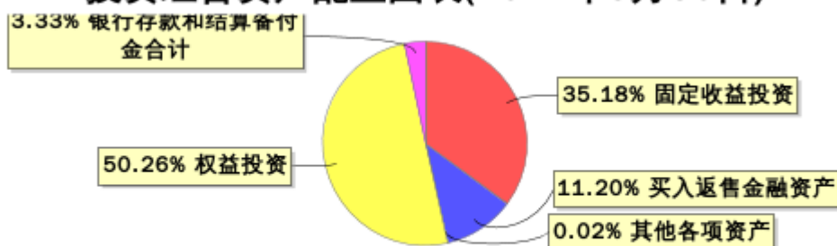
投资组合资产配置图表(2022年9月30日)

● 固定收益投资 ● 买入返售金融资产 ● 其他各项资产 ● 权益投资 ● 银行存款和结算备付金合计