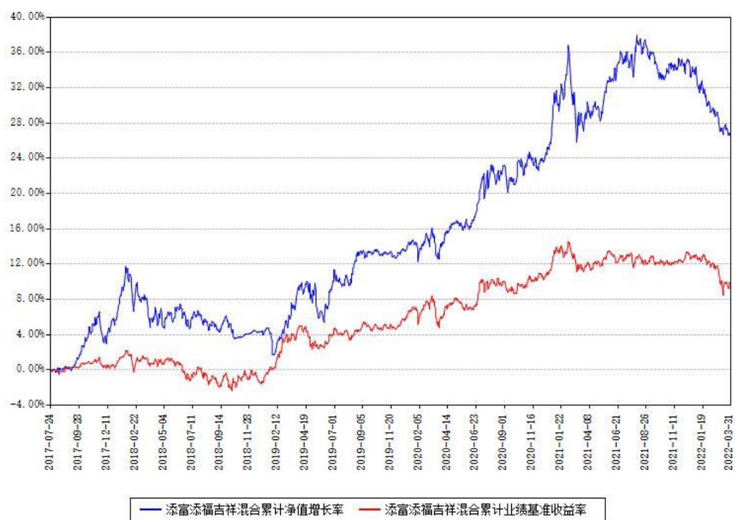
添富添福吉祥混合累计净值增长率与同期业绩基准收益率对比图