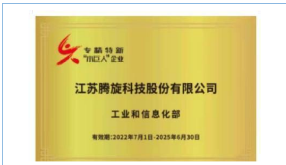
公司入选工信部第四批专精特新“小巨人”企业。