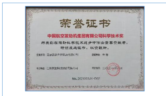
获得中国航空发动机集团有限公司科技技术进步奖。