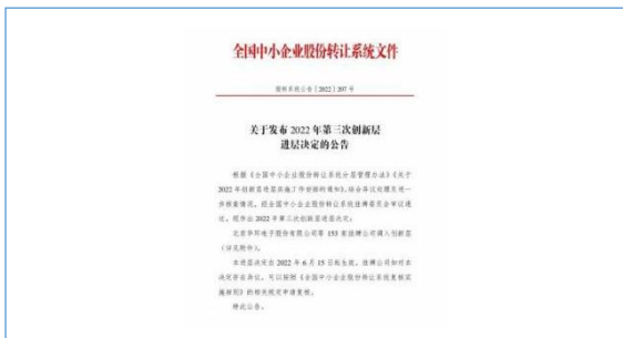
公司股票调入创新层。