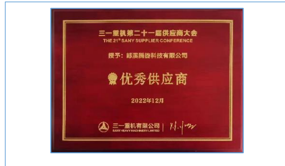
获评三一重机 2022 年度优秀供应商。