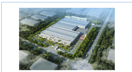
子公司郎溪腾旋二期工程开工建设，扩建新能源风电产品产能。