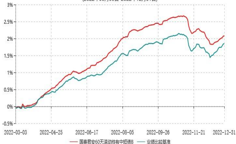
国泰君安60天滚动持有中短债B累计净值增长率与业绩比较基准收益率历史走势对比图 (2022年03月03日-2022年12月31日)