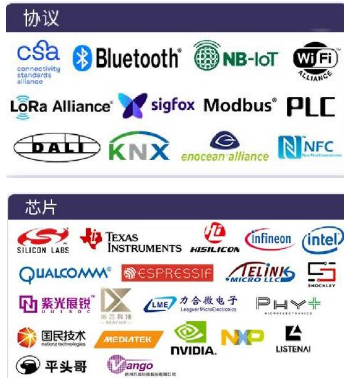
CSHIA Research 《2022 中国智能家居产业链生态图谱》

2020 年度，CSHIA Research 曾经发布了《2020 中国智能家居生态发展白皮书》，在智能家居领域具有较强的影响力。2022 年初，CSHIA Research 再度详细梳理智能家居硬件制造产业链阵营，已将 PLC 与 WiFi、蓝牙等并列为通信协议，并将力合微列示在智能家居相关芯片企业中。