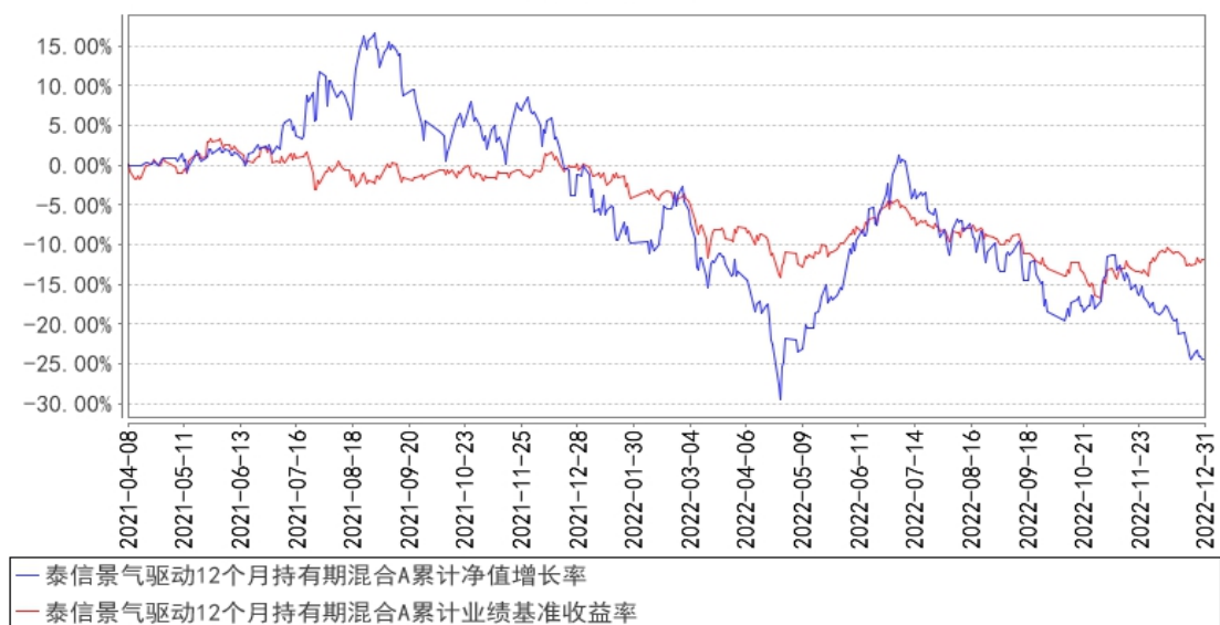
泰信景气驱动12个月持有期混合A累计净值增长率与同期业绩比较基准收益率的历史走势对比图