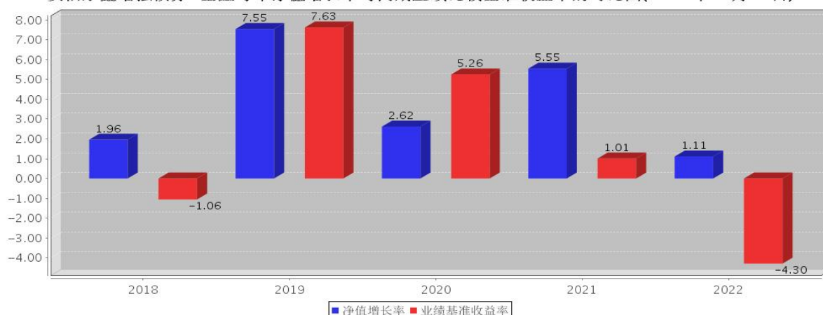
安信永鑫增强债券C基金每年净值增长率与同期业绩比较基准收益率的对比图(2022年12月31日)

注:基金合同生效当年期间的相关数据按实际存续期计算。基金的过往业绩并不代表其未来表现。本基金由安信永鑫定期开放债券型证券投资基金变更注册而来。根据2018年5月14日基金份额持有人大会决议,自2018年6月12日起,《安信永鑫增强债券型证券投资基金基金合同》生效,《安信永鑫定期开放债券型证券投资基金基金合同》同一日起失效。