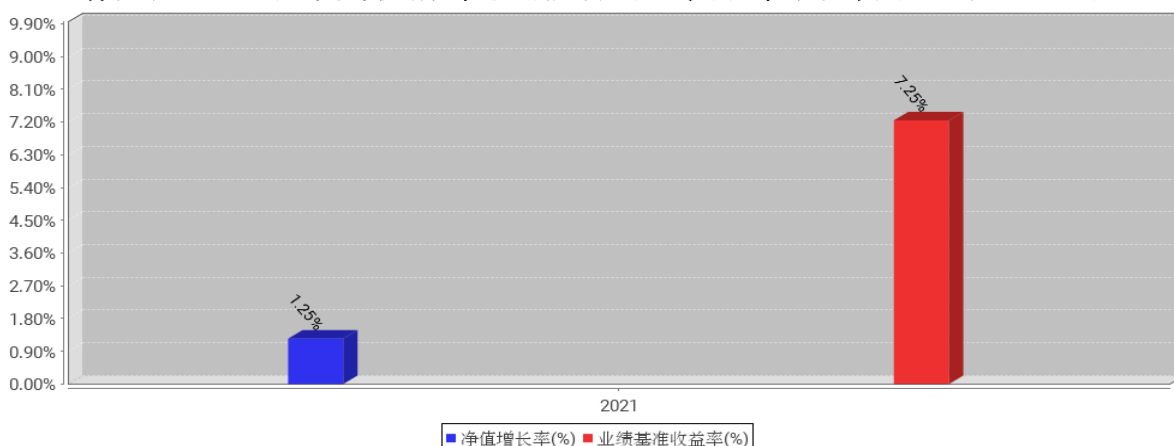
物联网ETF工银基金每年净值增长率与同期业绩比较基准收益率的对比图（2021年12月31日）

注：1、本基金基金合同于 2021 年 6 月 18 日生效。合同生效当年不满完整自然年度的，按实际期限计算净值增长率。