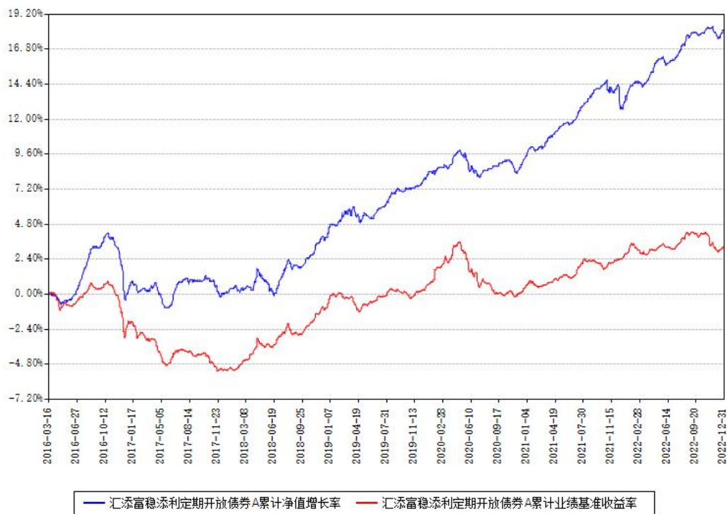
汇添富稳健添利定期开放债券A累计净值增长率与同期业绩基准收益率对比图