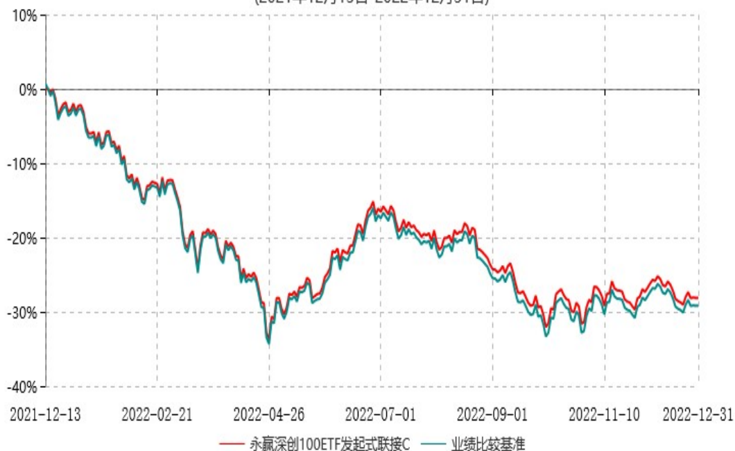
永赢深创100ETF发起式联接C累计净值增长率与业绩比较基准收益率历史走势对比图 (2021年12月13日-2022年12月31日)