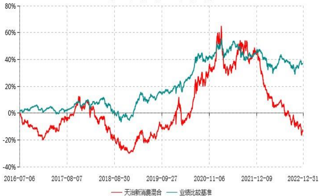
天治新消费灵活配置混合型证券投资基金累计净值增长率与业绩比较基准收益率历史走势对比图 (2016年07月06日-2022年12月31日)