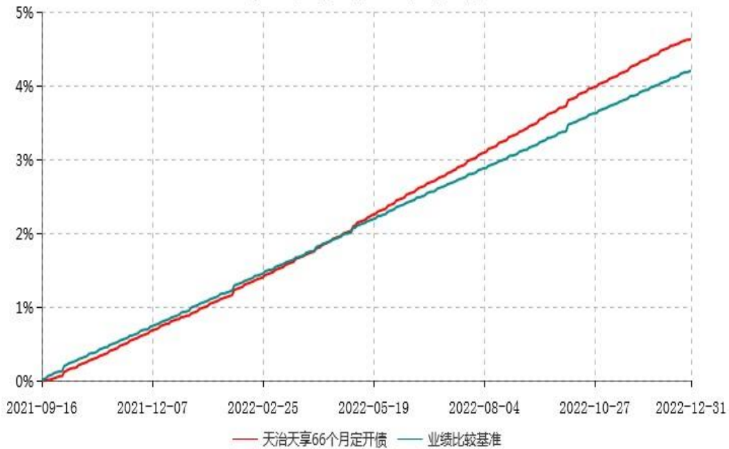
天治天享66个月定期开放债券型证券投资基金累计净值增长率与业绩比较基准收益率历史走势对比图 (2021年09月16日-2022年12月31日)