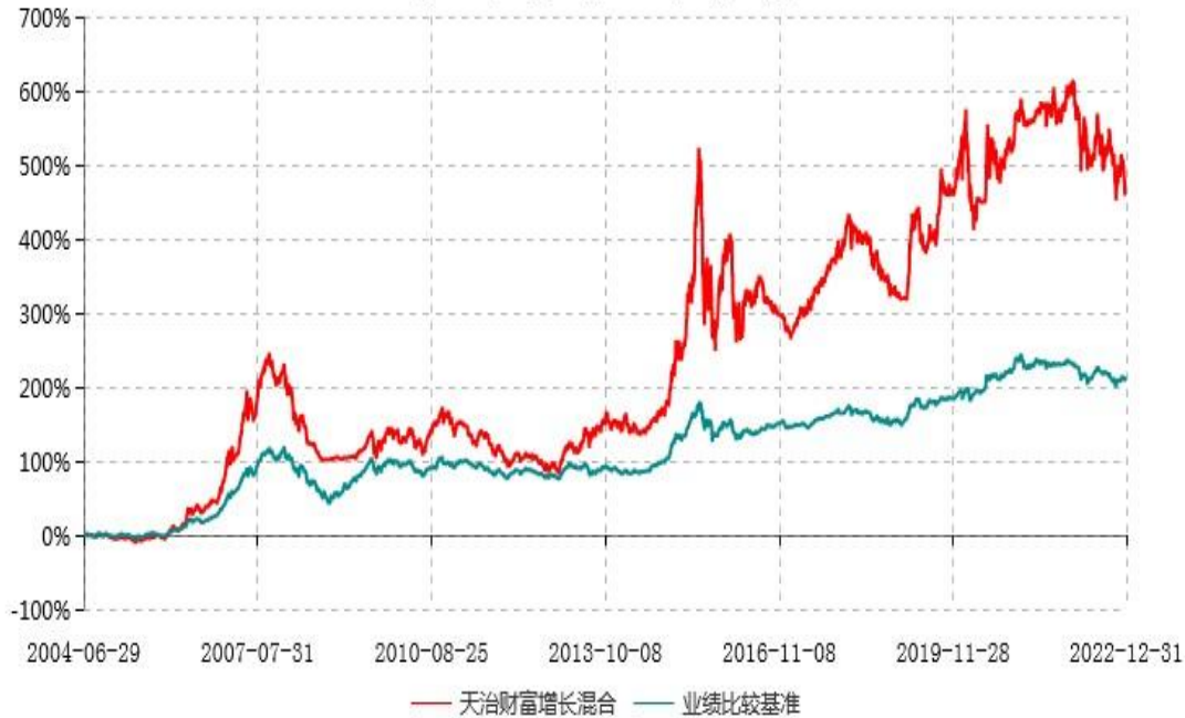
天治财富增长证券投资基金累计净值增长率与业绩比较基准收益率历史走势对比图 (2004年06月29日-2022年12月31日)