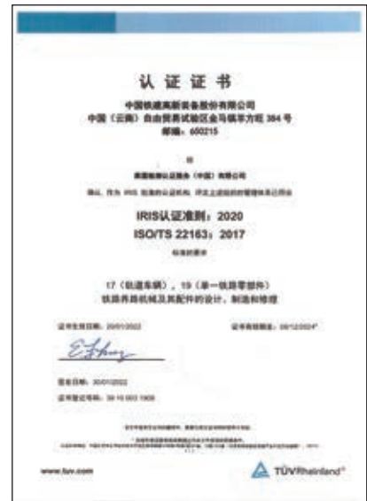
ISO/TS 22163 經營管理體系 認證證書

本公司堅持「精益求精、造精品機械，追求卓越、創一流品牌」的質量方針，堅持推行ISO/TS 22163(IRIS)鐵路及軌交行業經營管理體系、ISO9001質量體系、CRCC產品認證體系、EN15085焊接體系、CNAS實驗室認證體系等「一體化」管控質量體系，結合企業實際創新質量管理模式並推廣落實。本公司建立集團管控一體化質量管理體系，形成管控手冊、過程管理規範及相關質量管理制度等百餘個管控體系文件並組織執行。本公司亦健全、完善質量管理機構，建立質量目標管理機制並組織簽訂質量包保責任狀，進行逐級分解與考核；嚴格按體系要求對本公司產品涉及的營銷、材料及零部件採購、生產組織與控制、質量檢測與試驗、整機驗收、產品交付與服務等過程實施規範管理與全過程質量控制，確保本公司所生產產品滿足產品質量要求及用戶要求；根據《中央企業全面風險管理指引》標準建立質量安全風險管理體系並實施形成覆蓋本公司產品設計、供應鏈管理、生產製造、售後服務、質量監督與考核等過程質量安全風險運行管理機制；強化關鍵工序、特殊過程及產品「八防」(防裂損、防脫落、防燃／熱軸、防斷裂、防爆炸、防火災、防分裂、防放颺)質量風險點控制，嚴格落實過程作業指導及關鍵質量監控要求點檢控制創新模式，健全過程質量異常報告及鐵路交通事故應急管理機制，全面推行質量安全風險管理控制，確保整機產品質量安全及鐵路運輸安全，始終履行「為鐵路強基固本」的企業使命。