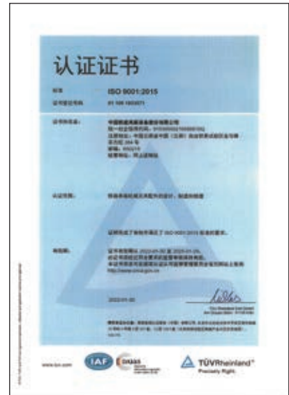
ISO 9001 質量管理體系 認證證書

為充分確保並驗證本公司具備持續提供滿足市場與用戶需求的產品及服務質量保證能力，本公司嚴格按國家體系認證監管要求，每年定期接受資質認可權威機構審查，獲頒發的專業體系證書並保持。為本公司產品准入並參與國內外市場競爭提供有力支撐和保障，增強企業綜合競爭力，推動企業健康、可持續發展。