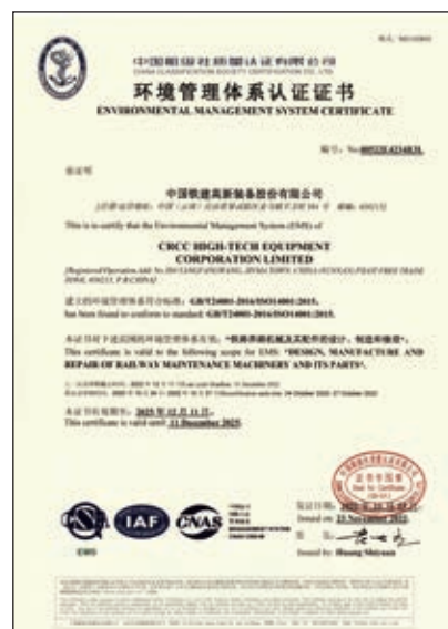
環境管理體系認證證書 GB24001-2016/ISO14001 : 2015

本公司二零一三年按照GB/T24001:2004環境管理體系標準建立並通過環境管理體系認證，二零一六年按照ISO14001:2015對體系進行了換版，並通過認證。二零二二年通過GB24001-2016/ISO14001:2015體系再認證，並持續取得環境管理體系認證證書。