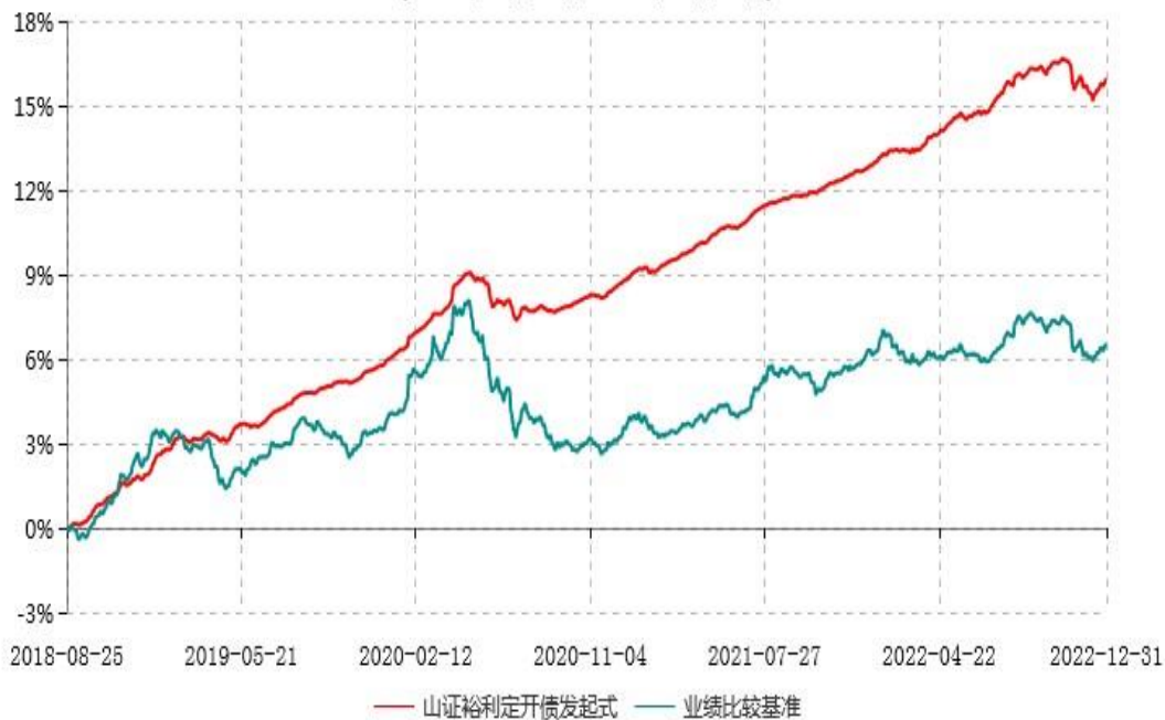
山西证券裕利定期开放债券型发起式证券投资基金累计净值增长率与业绩比较基准收益率历史走势对比图 (2018年08月25日-2022年12月31日)