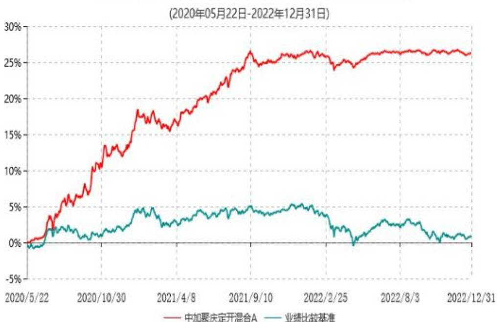
中加聚庆定开混合A累计净值增长率与业绩比较基准收益率历史走势对比图

2、自基金合同生效以来基金累计净值增长率变动及其与同期业绩比较基准收益率变动的比较