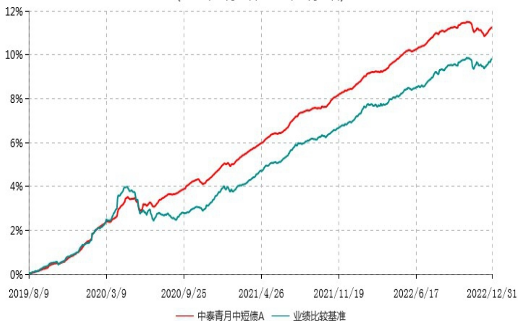
中泰青月中短债A累计净值增长率与业绩比较基准收益率历史走势对比图 (2019年08月09日-2022年12月31日)