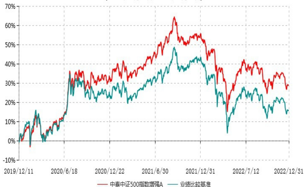
中泰中证500指数增强A累计净值增长率与业绩比较基准收益率历史走势对比图 (2019年12月11日-2022年12月31日)