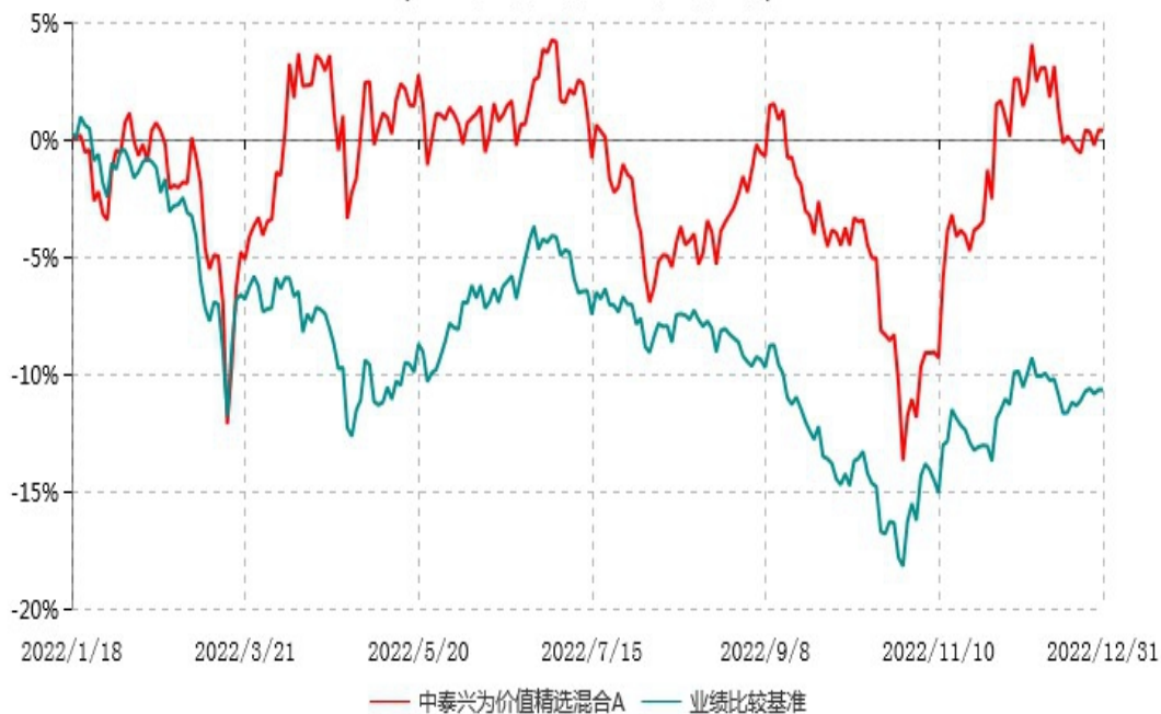
中泰兴为价值精选混合A累计净值增长率与业绩比较基准收益率历史走势对比图 (2022年01月18日-2022年12月31日)