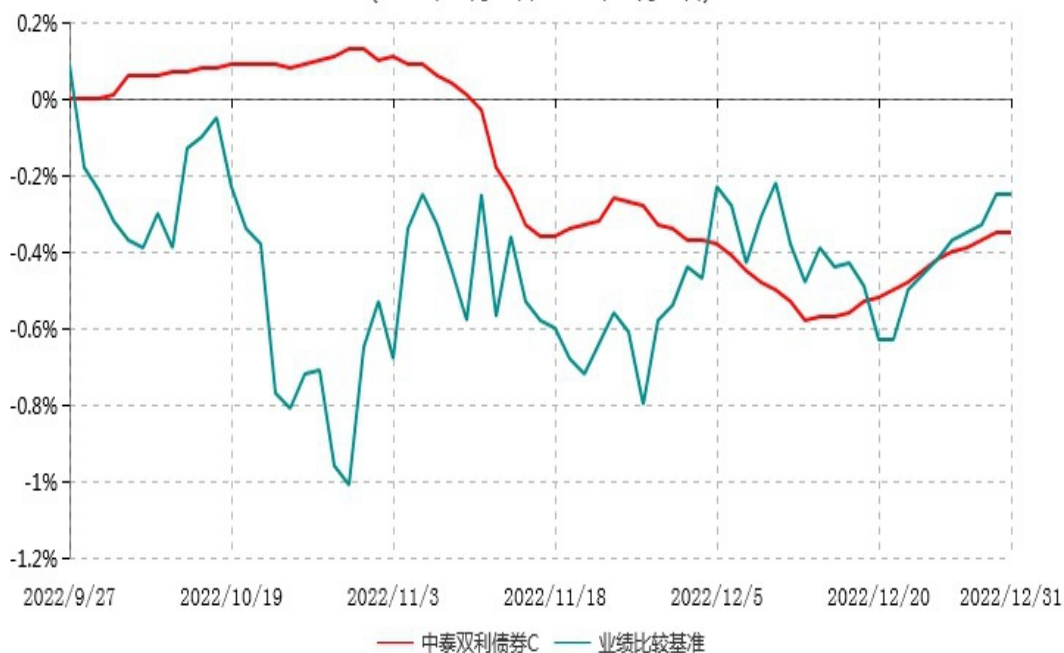
中泰双利债券C累计净值增长率与业绩比较基准收益率历史走势对比图 (2022年09月27日-2022年12月31日)