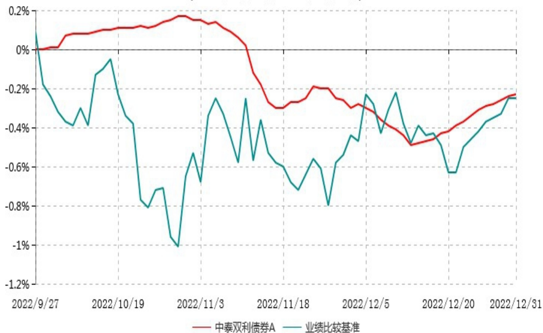
中泰双利债券A累计净值增长率与业绩比较基准收益率历史走势对比图 (2022年09月27日-2022年12月31日)