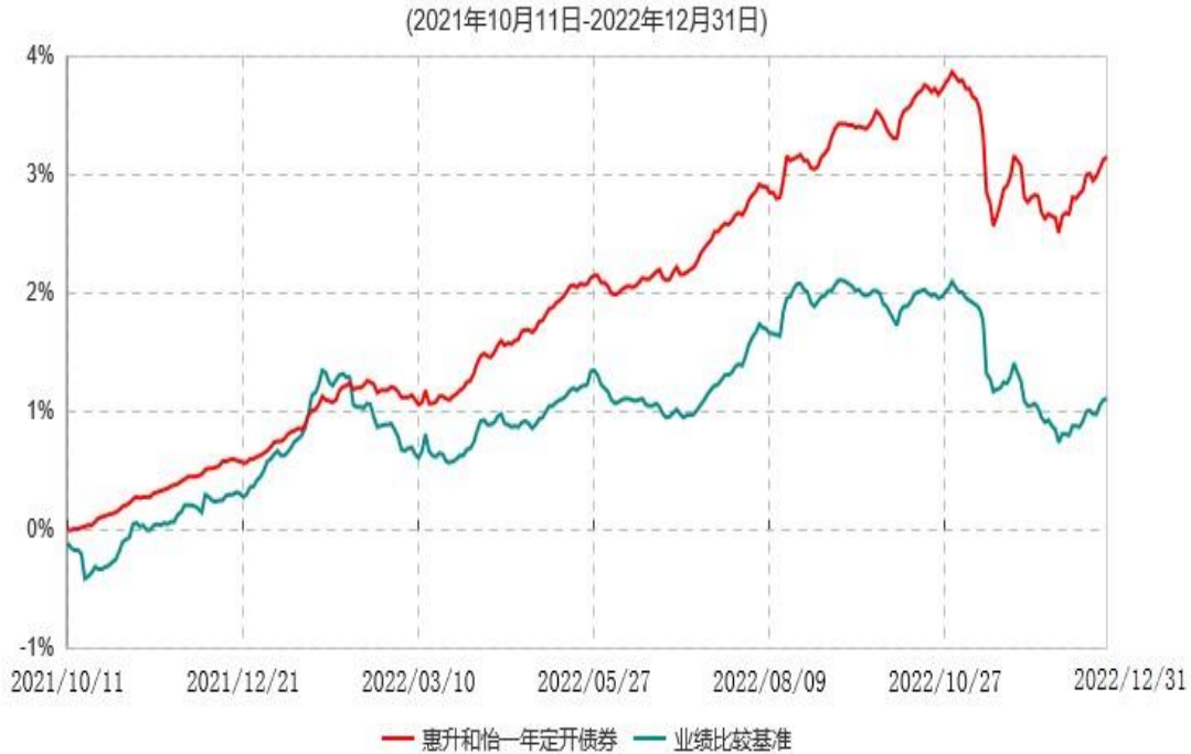
惠升和怡一年定期开放债券型发起式证券投资基金累计净值增长率与业绩比较基准收益率历史走势对比图