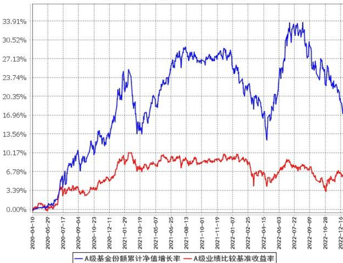
A级基金份额累计净值增长率与同期业绩比较基准收益率的历史走势对比图 (2020年4月10日至2022年12月31日)