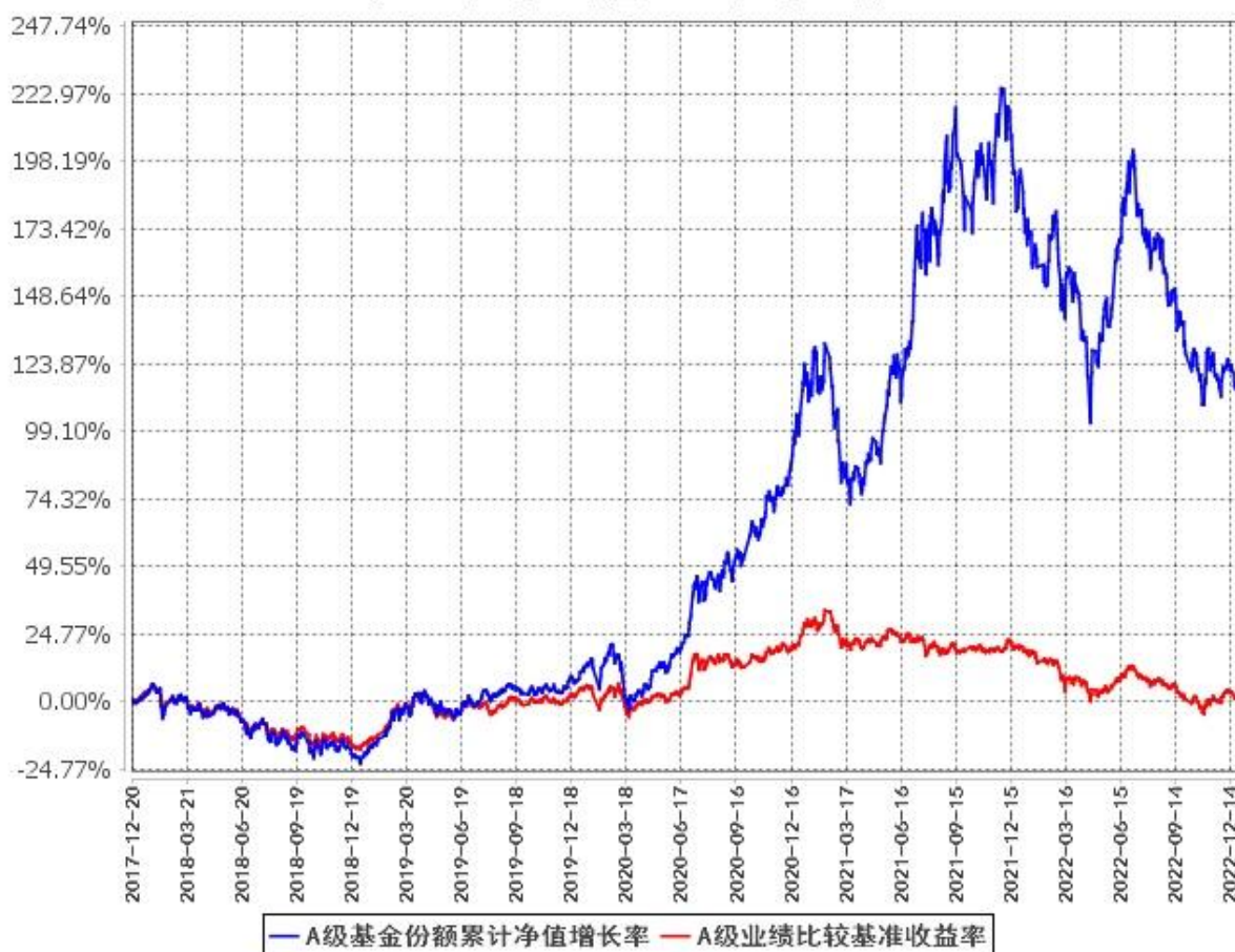
A级基金份额累计净值增长率与同期业绩比较基准收益率的历史走势对比图 (2017年12月20日至2022年12月31日)