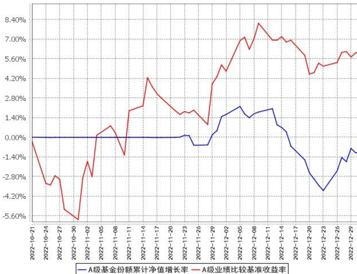
A级基金份额累计净值增长率与同期业绩比较基准收益率的历史走势对比图 (2022年10月21日至2022年12月31日)