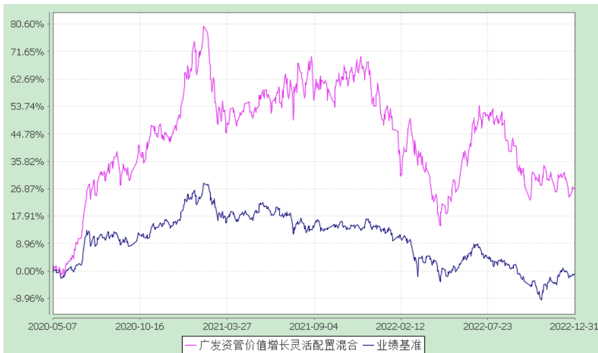
广发资管价值增长灵活配置混合型集合资产管理计划 份额累计净值增长率与业绩比较基准收益率历史走势对比图 (2020 年 5 月 7 日至 2022 年 12 月 31 日)